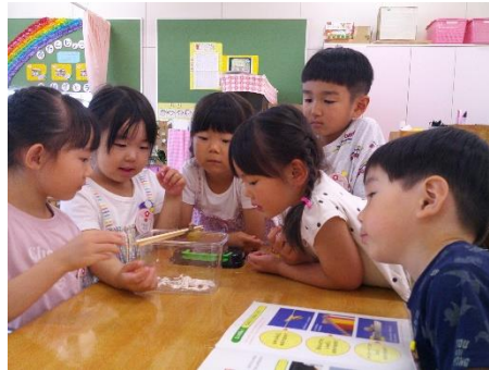
もも組には大きなカタツムリがいます。お当番さんが、お世話をしています。