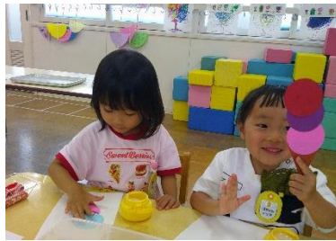
おいしいアイスを作りました。のりの使い方も、上手になりました。