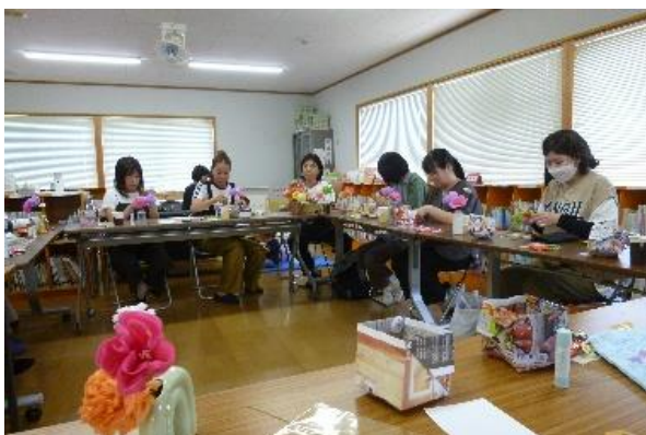
PTA主催のワークショップを行いました。講師も保護者の方です。真剣に作りながらも、会話が弾み、和気あいあい、楽しい時間でした。同じ材料を使っても、それぞれ個性豊かな素敵なお花ができました。日々の忙しい中でも、お花を作って飾りホッとできる時間となったのではないのでしょうか。次回も楽しみです。