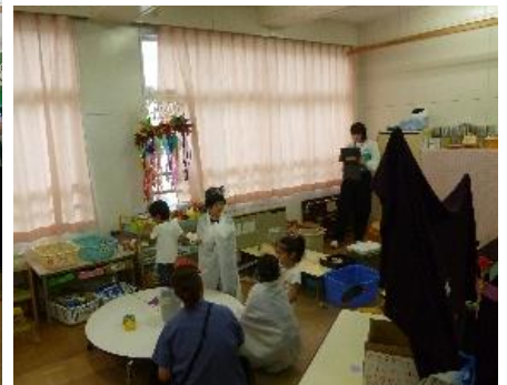
あやめ組のお部屋は、おばけがいっぱい。おばけ学校、おばけ病院もあります。なりたいおばけになって、友達と楽しく遊んでいます。