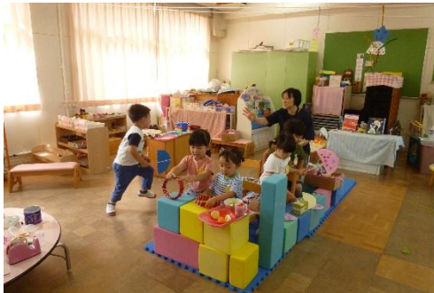
みんなでお買い物に「しゅっぱ〜つ！」