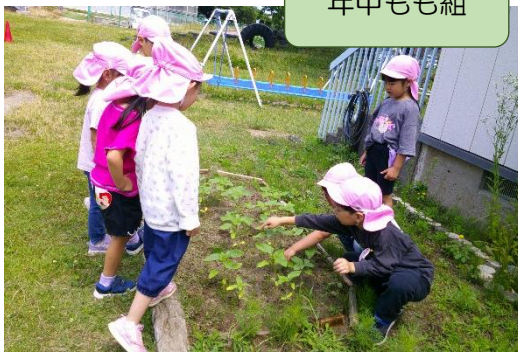
ひまわりの種をまきました。大きくなってきたね！